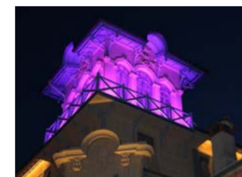
Le Prix Régional des Rubans du Patrimoine 2018 pour la Villa Alexandrine, ici aux couleurs de la journée mondiale de lutte contre les maladies inflammatoires chroniques de l'intestin.

Cette récompense valorise les efforts des collectivités pour redonner vie aux bâtiments historiques délaissés dont la réhabilitation est une réussite. Le projet vençois de rénovation complète de la Villa Alexandrine à l'état d'abandon, s'est parfaitement inscrit dans cette démarche. Aujourd'hui Office de Tourisme et Espace Muséal dédié à Witold Gombrowicz, la Villa Belle Epoque est désormais un lieu de vie incontournable de la Cité des Arts.