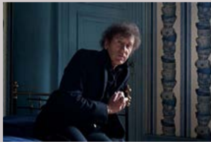
Figure majeure de la chanson française, ce grand artiste nous fait l'honneur de rencontrer son public à Vence.