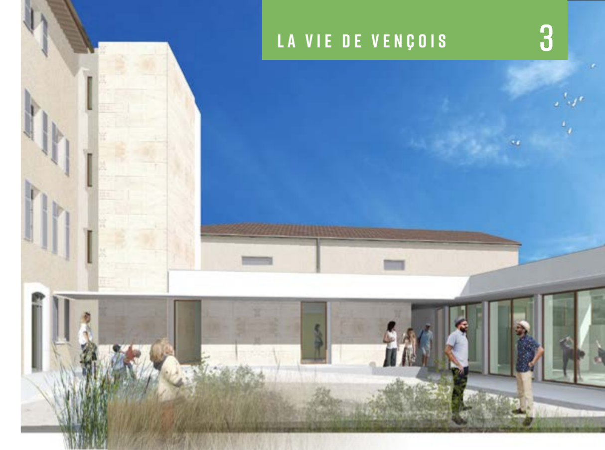
Esquisse de la cour arrière du bâtiment et de ses nouvelles salles aux larges espaces vitrés, dédiées aux activités corporelles.