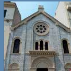
Synagogue de Nice