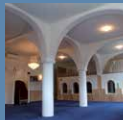
Salle de prière musulmane