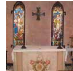
Eglise anglicane et église protestante