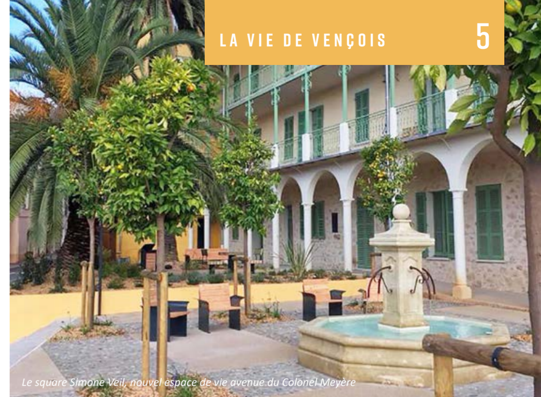
Le square Simone Veil, nouvel espace de vie avenue du Colonel Meyère

Par ce geste, la Municipalité a souhaité rendre un juste hommage à cette per-