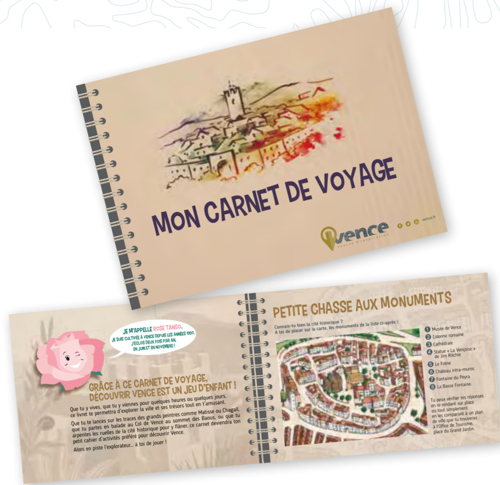
Le carnet de voyage à hauteur d'enfant est disponible gratuitement à l'Office de Tourisme et distribué dans toutes les écoles pour faire découvrir aux plus jeunes leur patrimoine.

La Municipalité, fortement impliquée dans ce domaine, a à cœur de proposer aux enfants des activités enrichissantes et divertissantes dans une démarche éducative choisie.