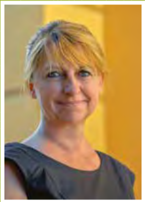
Le Maire de VENCE, Présidente du SIVOM du Pays de VENCE Conseillère au développement pour la Métropole

Déjà 25 mois ... J'ai repris les rênes municipales pour mener à bien notre ville, pour concrétiser les projets que Vence méritait et que les Vençois attendaient. J'ai dialogué, échangé, écouté avec attention et interrogé les besoins dans chaque secteur. Sur tous les fronts, j'ai adopté une méthode, pour faire aboutir, au plus vite et au juste prix, les grands projets espérés depuis longtemps. Ainsi, chaque dossier a été adapté aux besoins et aux réalités du territoire et des finances, en réduisant au maximum les coûts, sans entraver leur qualité, leur fonctionnalité et leur plus-value pour Vence. Jour après jour, je me suis attelée à réduire les dépenses publiques en maintenant des projets nécessaires, structurants et d'avenir. C'est ainsi qu'un nouveau Centre culturel, moderne et central, ouvrira ses portes le 28 septembre avec une baisse de 700.000€ sur le programme initial et avec une subvention exceptionnelle de 500.000€ de la Métropole. C'est ainsi que le futur Grand Jardin, digne de ce nom, rajeuni, végétalisé sera ouvert à tous et à toutes les festivités sans entraver nos finances.