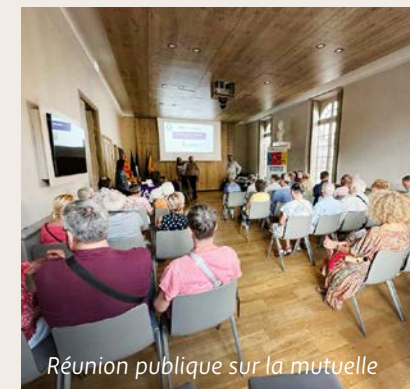
Réunion publique sur la mutuelle

185 000 € de dons ont été récoltés pour une réhabilitation de la Villa et sa future ouverture au public.