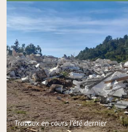
Travaux en cours l'été dernier

Les riverains du secteur ont pu tourner une page difficile.