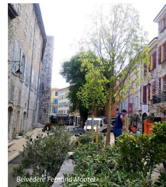
Belvédère Fernand Moutet