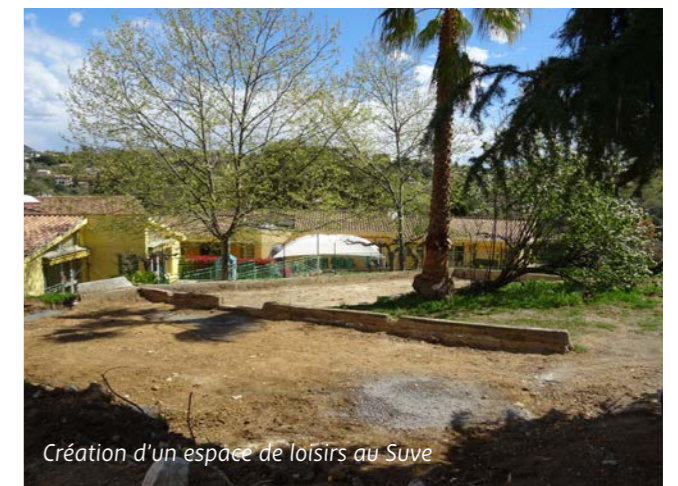
Création d'un espace de loisirs au Suve

Un beau projet de proximité, de partage et de convivialité sur ce site également agrémenté il y a quelques mois de plusieurs arbres fruitiers plantés par le service espaces verts de la Ville.