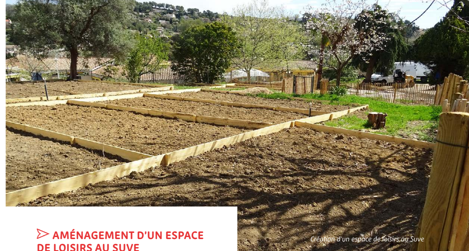
Création d'un espace de loisirs au Suve

« La solidarité communale permet aux habitants du quartier de reprendre un vie plus sereine, 23 ans après le glissement de terrain qui a révélé l'instabilité du secteur. »