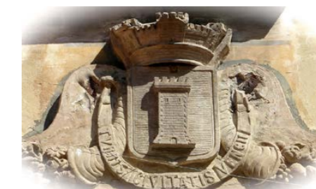
CONFÉRENCES : L'UNIVERSITÉ DANS LA VIE DU PAYS VENÇOIS