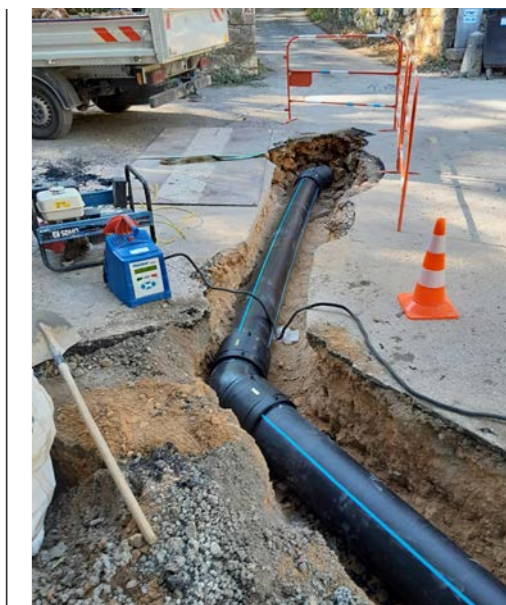
Réfection du tapis d'enrobé chemin des Salles après le remplacement de la canalisation d'eau potable

L'intensité de l'éclairage est nettement supérieure à l'équipement précédent, mais bien moins gourmand en énergie. La Ville a également procédé à l'installation d'une horloge automatisant l'extinction des candélabres à 22h après les entraînements des joueurs, afin d'éviter les oublis qui ont pu être constatés. Par ailleurs, elle étudie la possibilité de moduler la puissance de l'éclairage en fonction des besoins (matches ou entraînements).