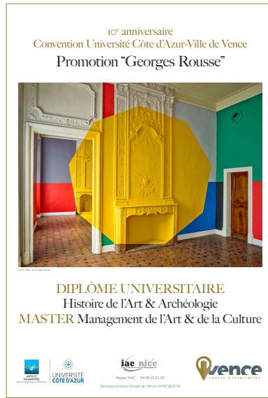
G. Rousse, 2021