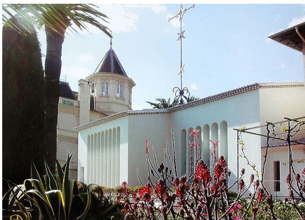
Chapelle du Rosaire - Vence