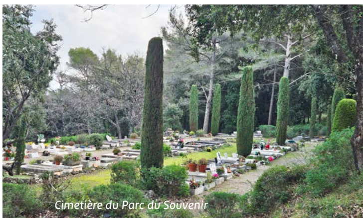
Cimetière du Parc du Souvenir

① La gestion du cimetière intercommunal du Parc du Souvenir à la Sine avec la vente, le renouvellement de concessions funéraires ainsi que l'entretien assuré par un agent du SIVOM. Cette année, une extension du cimetière est programmée . Le projet qui a demandé au