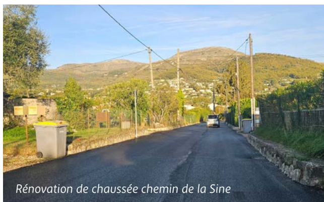
Rénovation de chaussée chemin de la Sine

Au cours des derniers mois, la Métropole a procédé à des travaux sur le territoire de notre commune à commencer par différentes rénovations de voiries.