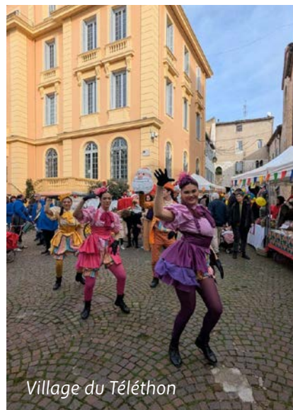
Village du Téléthon