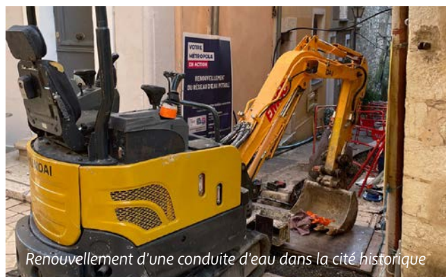
Renouvellement d'une conduite d'eau dans la cité historique

En matière de réseaux, la Métropole Nice Côte d'Azur a mené d'importants travaux de renouvellement sur les conduites d'eau potable dans le cœur historique de Vence : Rue de la Coste et Rue du Séminaire . Ces opérations ont permis de remplacer les anciennes canalisations, de reprendre tous les branchements dans le but de garantir une alimentation en eau fiable et sans déperdition. Le revêtement de la rue de la Coste a ensuite été rénové à l'identique.