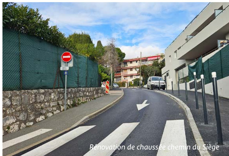
Rénovation de chaussée chemin du Siège

nue Colonel Méyère. Sur le chemin du Siège , des travaux d'aménagement de la voirie ont aussi été entrepris. Après l'achèvement d'une construction en partie basse, un trottoir a été créé pour sécuriser le cheminement piéton et la chaussée vieillissante a été rénovée jusqu'au carrefour du Puits du Renard.