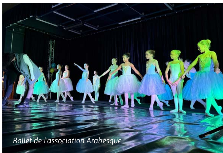
Ballet de l'association Arabesque