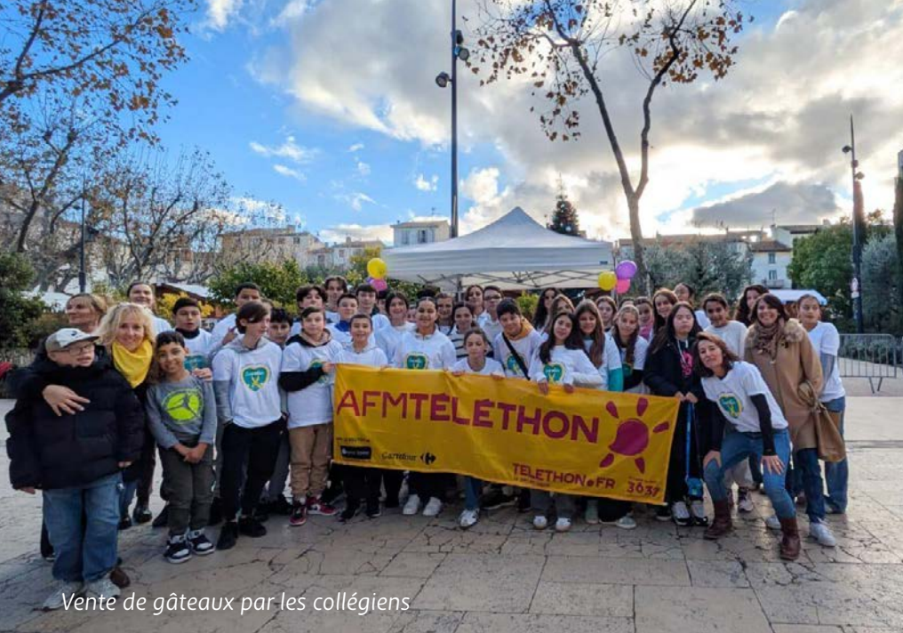
Vente de gâteaux par les collégiens