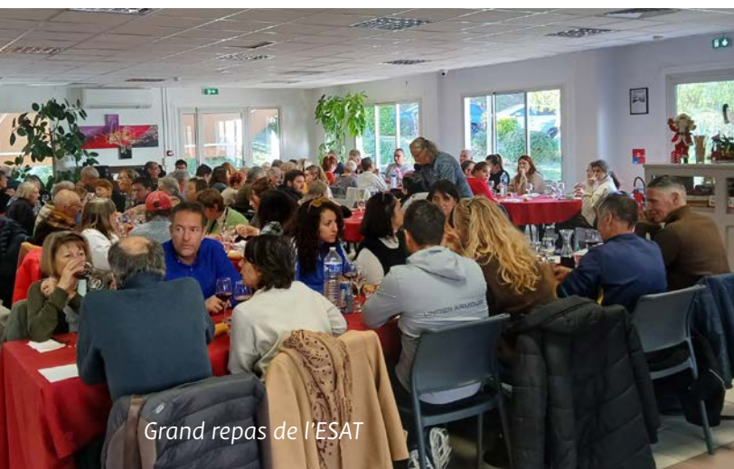
Grand repas de l'ESAT

Un record a été battu cette année avec un montant de 31 960,10 € (24 914€ l'année dernière) qui sera remis prochainement à l'AFM.