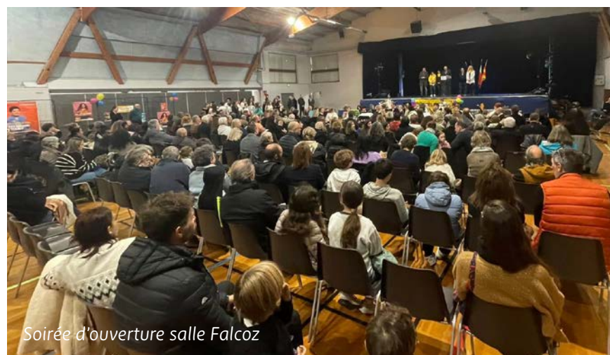
Soirée d'ouverture salle Falcoz

Les associations vençaises ont largement participé en organisant de multiples événements : Nuit du Volley, descente VVT du Col de Vence, Nuit des Arts Martiaux, Bourse aux jouets, grand loto de l'AVF, tournoi de Bridge, gala de danse, randonnée au Baou des Blancs etc... Toutes les générations se sont im-