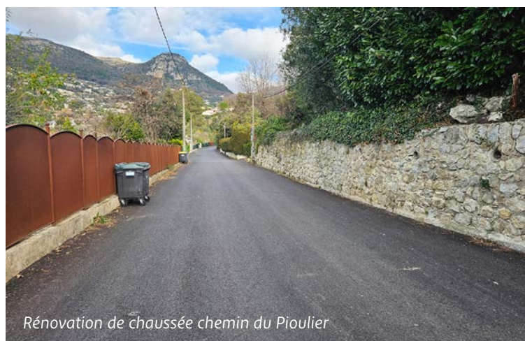
Rénovation de chaussée chemin du Pioulier

Une nouvelle portion du chemin de la Sine a ainsi été rénovée à l'automne, ainsi qu'une partie du chemin du Pioulier , du chemin de Sainte Colombe , et de l' ave-