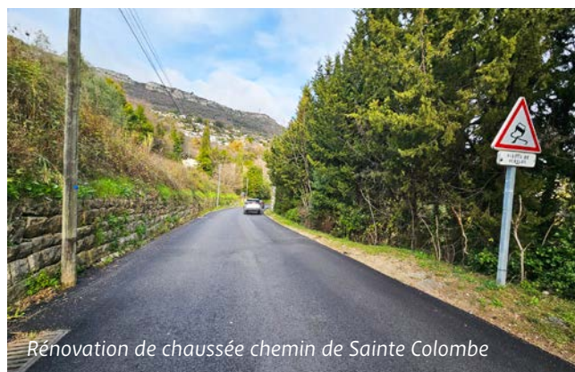
Rénovation de chaussée chemin de Sainte Colombe

nue Colonel Méyère. Sur le chemin du Siège , des travaux d'aménagement de la voirie ont aussi été entrepris. Après l'achèvement d'une construction en partie basse, un trottoir a été créé pour sécuriser le cheminement piéton et la chaussée vieillissante a été rénovée jusqu'au carrefour du Puits du Renard.