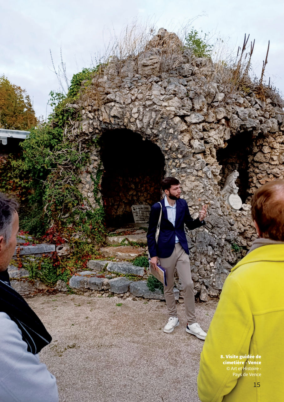
8. Visite guidée de cimetièrre - Vence